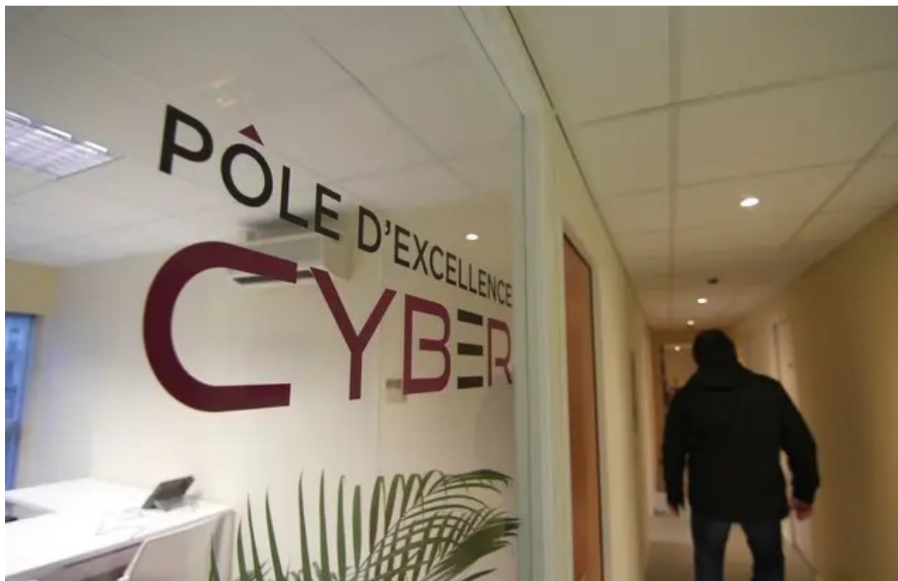
Illustration de la cyber sécurité, ici au pôle d'excellence Cyber, ouvert à la DGA de Bruz, près de Rennes.

Camille Allain | Publié le 02/12/19 à 15h05 — Mis à jour le 02/12/19 à 15h05